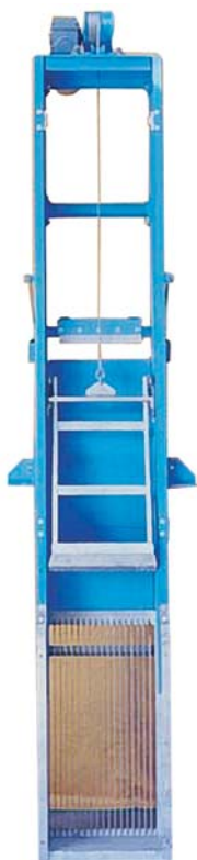
RS-002 鋼索式自動攔污機